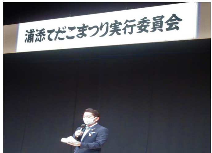
第44回(令和3年度)浦添てだこまつり実行委員会