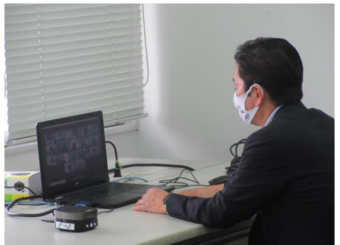
令和3年度 第1回校長連絡協議会(web会議)