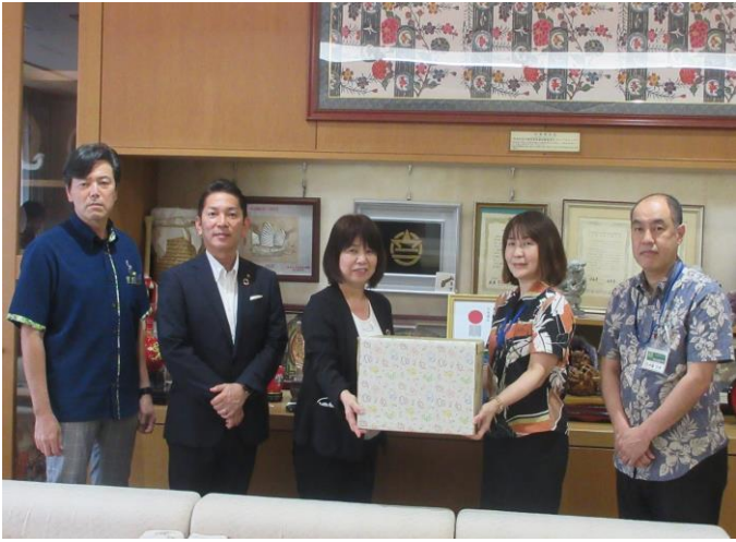
ホームセンターさくも様より生理用品の寄贈