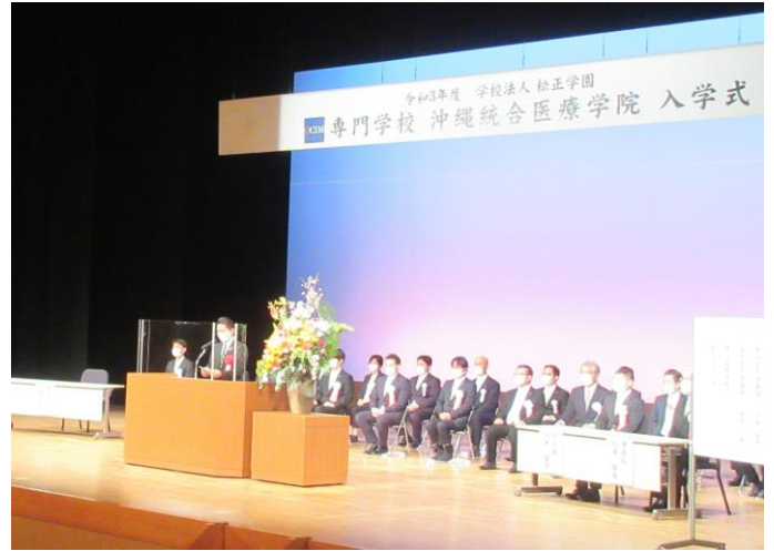
学校法人松正学園専門学校沖縄総合医療学院 2021年度入学式