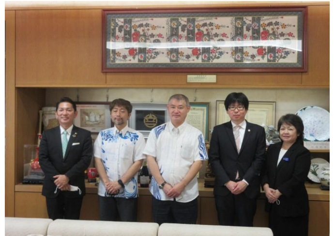
令和3年度浦添市法律相談員委嘱状交付式