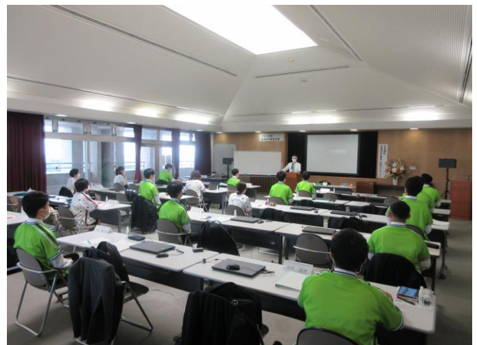
令和3年度新規採用職員研修(市長講話)