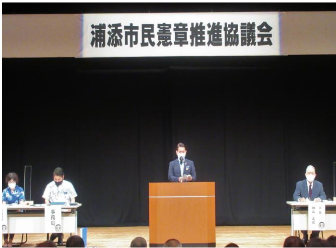
令和3年度 第39回浦添市民憲章推進協議会総会