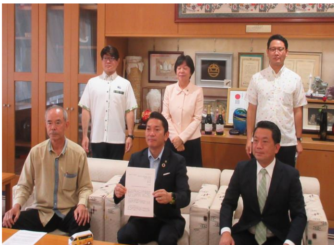
公明党派よりまん延防止等重点措置の 実施に関する緊急申し入れ