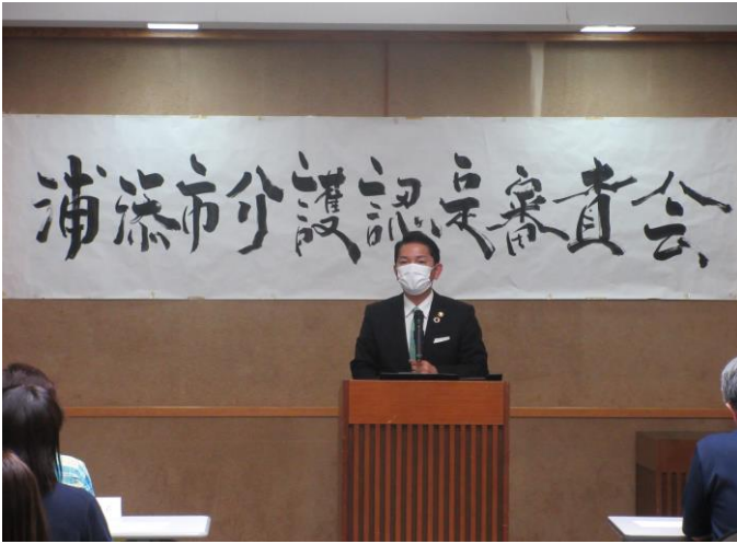
令和3年度介護認定審査会委員委嘱状交付式