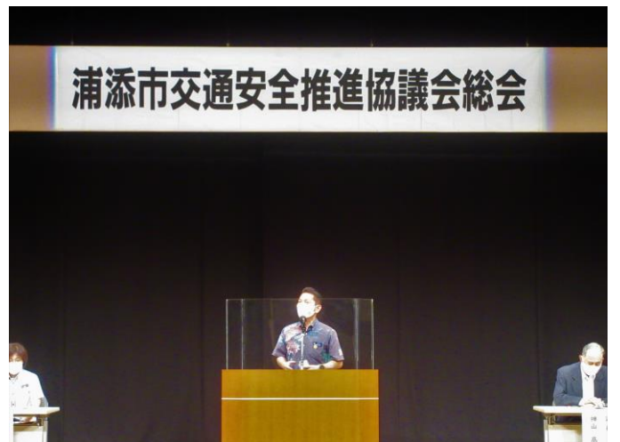
浦添市交通安全推進協議会総会