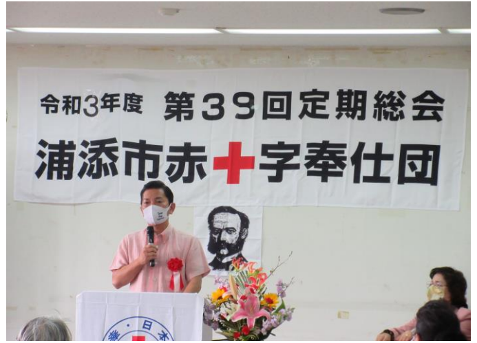
令和3年度浦添市地区赤十字定期総会