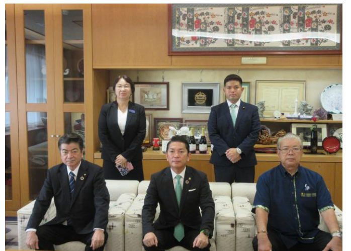
監査委員(議選)辞令交付式