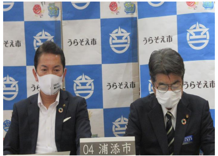
令和3年度沖縄振興拡大会議(Web会議)