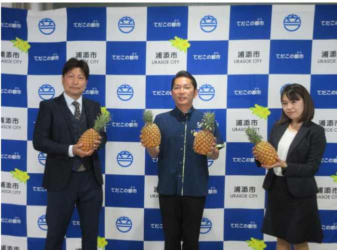
寄贈品贈呈式(マルユウグループ)