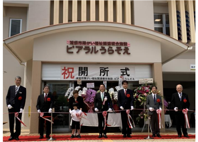
障がい福祉関連複合施設「ピアラルうらそえ」 開所式