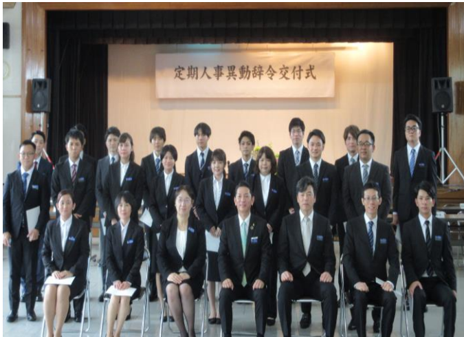
令和3年度定期人事異動辞令交付式