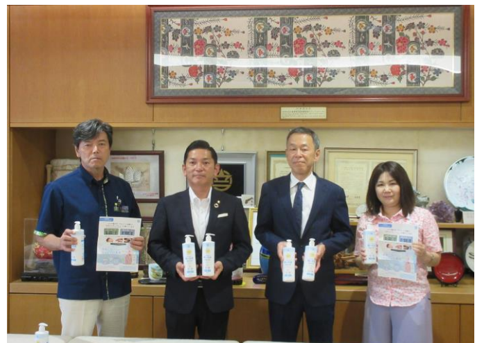
株式会社カイコーポレーション様より 除菌用ハンドジェルの寄贈