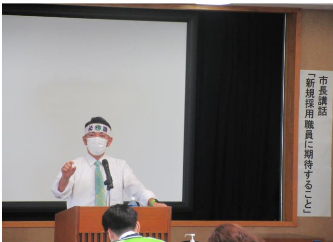
令和3年度新規採用職員研修(市長講話)