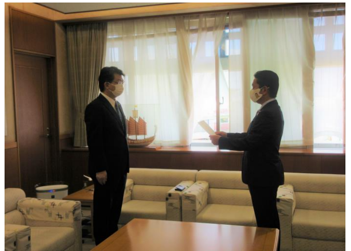
監査委員 辞令交付式