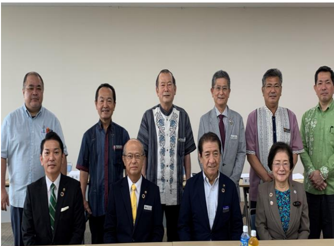
令和3年度第1回沖縄県市長会総会