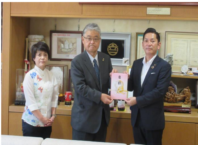
浦添市ふるさとでこの都市応援寄附金 贈呈式 (三和金属株式会社 様)