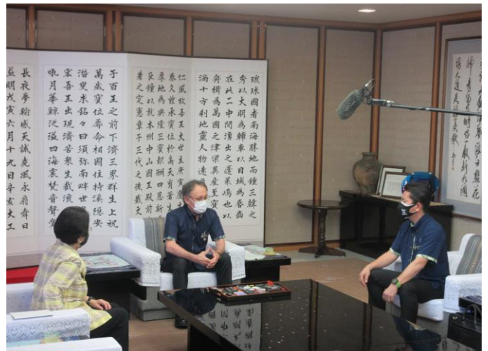
県知事・那覇市長・浦添市長の三者面談