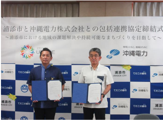
浦添市と沖縄電力株式会社との 包括連携協定締結式