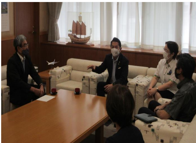
教育委員会委員 辞令交付式