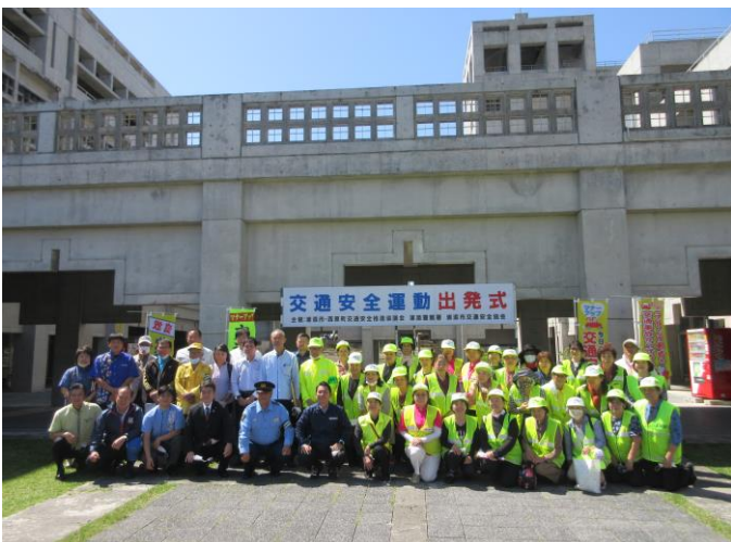
春の全国交通安全運動出発式