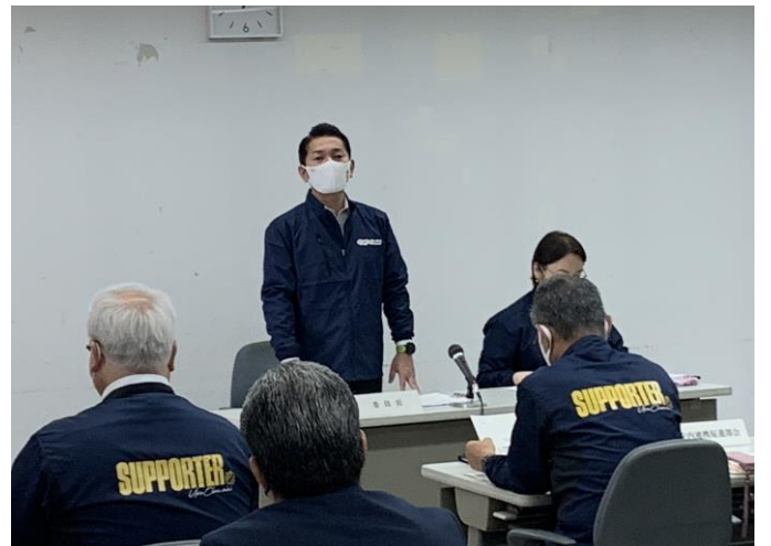
うらちゃんmini利用促進検討委員会