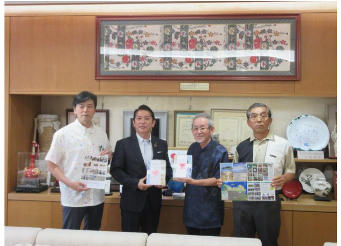
カーミージーの海で遊び隊様より新入生 への入学祝いパンフレット寄贈式