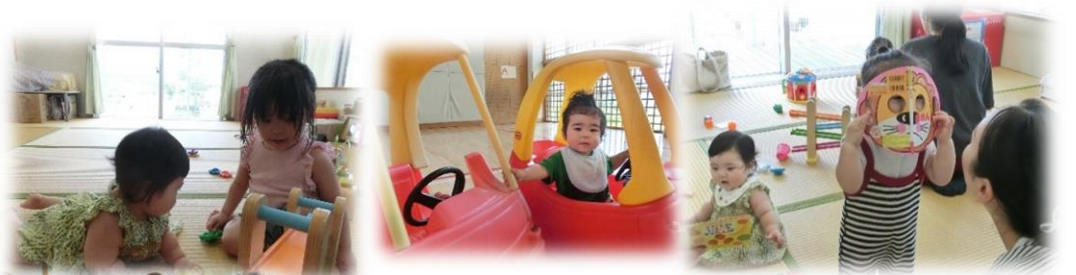
児童センターの玩具で遊んだり 広いスペースで乗る車も大人気です！