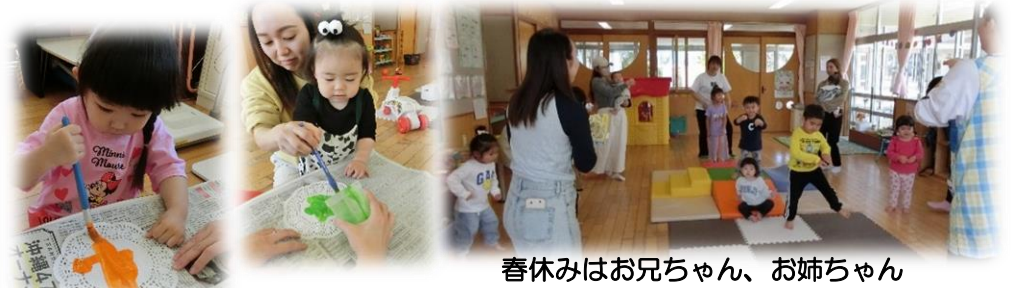
春休みはお兄ちゃん、お姉ちゃんも遊びに来てにぎやかでした！