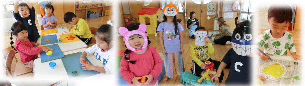
* お誕生日会 *