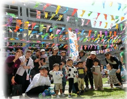
* 浦添市こいのぼり掲揚式 *