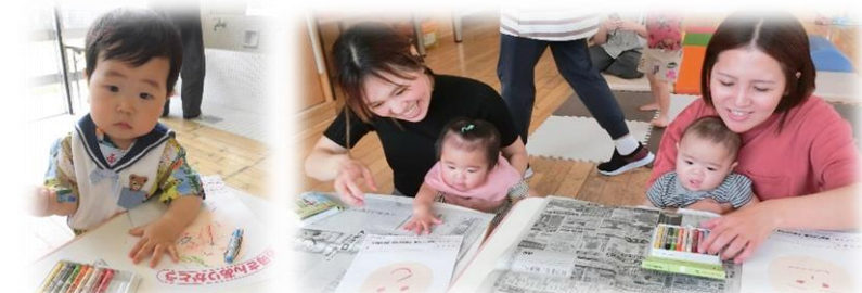
* 製作 *