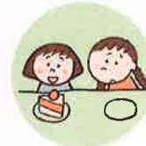
他のきょうだいは著しく差別的な扱いをすること