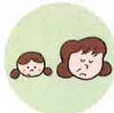
こどもを無視したり、拒否的な態度を示すこと