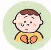
こどもの心や自尊心を傷つけるような言動をしたり、繰り返し言うこと