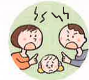
配偶者への暴力や暴言をこどもに見せること