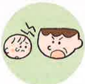
言葉で脅したり、脅迫すること

体罰は暴力でこどもの身体を傷つけるもので、心理的虐待は暴言などでこどもの心に深い傷を負わせるものです。こども本人への暴言でなくとも、配偶者や家族に対する強い言葉などもこどもの心を傷つけ、発達に影響する可能性があります。