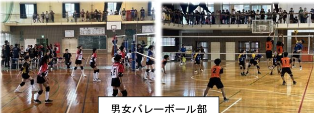
男女バレーボール部