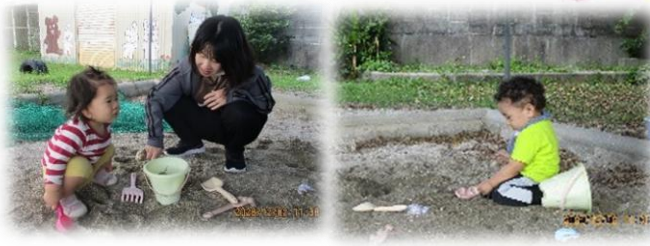
大好きお砂遊び♪全身砂まみれになって遊んでいたよ!