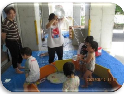
大粒のシャワー気持ちいい〜♡ ぺた・ぺた足跡ついてもたのしかったよ〜♪