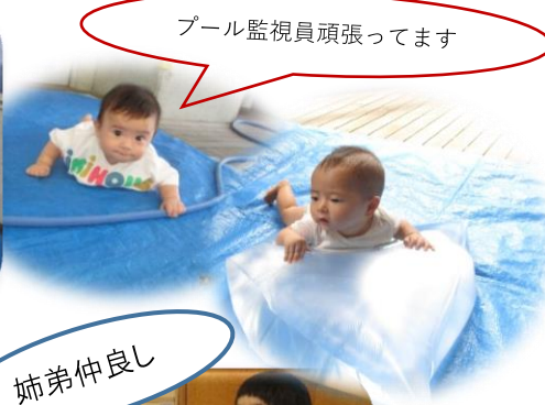
プール監視員頑張ってます