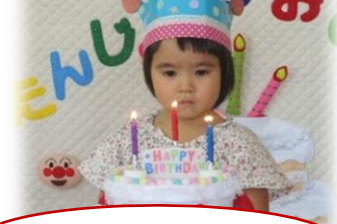
3さいになりました