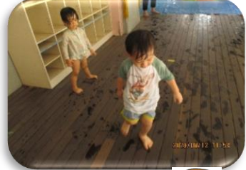
室内でも夏の遊び 楽しんだよ。