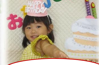
2さいになりました