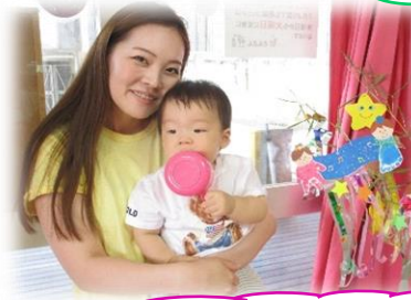
みんなで歩いたよ♡