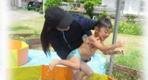
ぴちやぴちや楽しいね♪