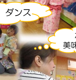
かき氷 美味しいね!