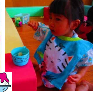
つめた～いシャーベット作り♡ひんやり美味しかったよ♡