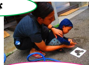
お誕生日おめでとう