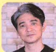
ナレーション 吉岡秀隆