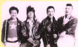
エンディングテーマ THE BLUE HEARTS『夢』

2020年に文部科学省の学習指導要領が「探究学習」に大きく舵を切りました。30年も前から「探究学習」を実践する認可校が「きのくに子どもの村学園」です。子どもの村学園に長期取材したドキュメンタリー映画『夢みる小学校』に、中学生パートを追加撮影した『夢みる小学校・完結編』の登場です！文部科学省選定映画『夢みる小学校』が、さらにアップデートしました。