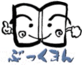
浦添市立図書館マスコットキャラクター