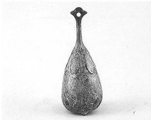
金-2 茄子形銅鈴 1個 日本 松岡一二氏 寄贈 高さ13.6 幅5.5 Copper bell. SUZU.