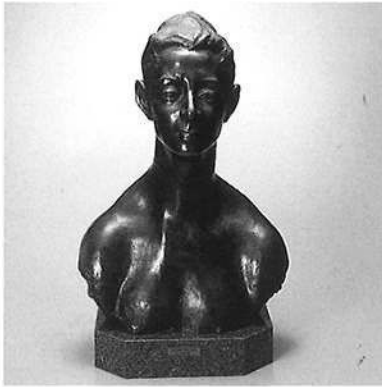
彫-1 La Bell' Emie No1 (美しきエミー) 1点 日本 高田博厚 銘苅ヒロ子氏 寄贈 高さ55.5 縦26.5 横35 銘-背面右下陰刻「H」 La Bell' Emie No. 1