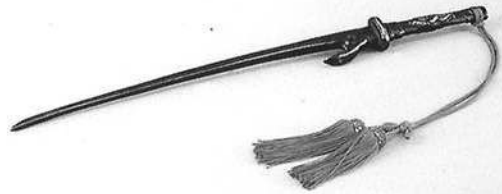
金-4 刀形十手 1本 日本 松岡一二氏 寄贈 長さ43.8 Short metal truncheon. JITTE.