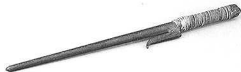
金-5 十手 1本 日本 松岡一二氏 寄贈 長さ39 Short metal truncheon. JITTE.