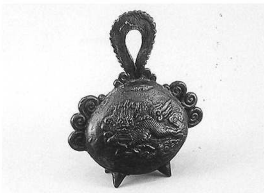
金-3 麒麟文銅鈴 1個 日本 松岡一二氏 寄贈 高さ19 幅16 Copper bell. SUZU.