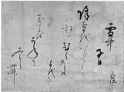
書-2 宜湾朝保書（雪中日子） 1幅 琉球 宜湾親方朝保（向有恒） 19世紀 嘉手納信子氏 寄贈 右下「朝保」 縦40 横52.5 New year's celebration. 31-syllable Japanese poem by GIWAN-CHOUHO.