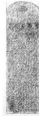
書-4 萬歲嶺記碑拓本 1幅 沖繩 制作年代不明 縦157 横45.5 Rubbing impression of BANZI-REIKI stele.