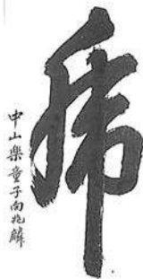
書-3 樂童子向兆麟の書（帛） 1幅 琉球 奥平親方朝宜（向兆麟） 19世紀 岡コレクション 右下「中山樂童子向兆麟」、落款：右上「善淵堂」・左下「向兆麟印」「朝宜」 縦120 横55 Tiger by SHOW-CHOURIN.