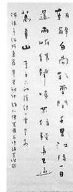
書-6 李白詩（早發白帝城） 1面 中国 陳奮武 移管 縦137 横51.5 左側「浦添市役所惠存 辛未秋仲頼川陳奮武於沖繩客次」、落款「陳奮武印」 Calligraphy of RIHAKU's poem.