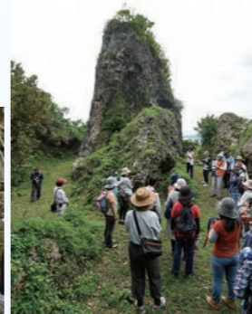
▲ガイド付きで分かりやすい