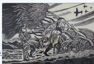
作品名 戦場の乙女たち

前年度に引き続き文化財課の所有する戦争遺物を展示し、より一層作品や平和教育への理解を深められる企画を行います。