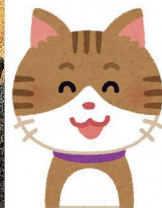
どんな野菜が売れた か 16 年間記録♪