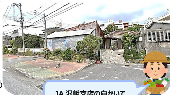
JA 沢岷支店の向かいで 朝市をやっているよ♪