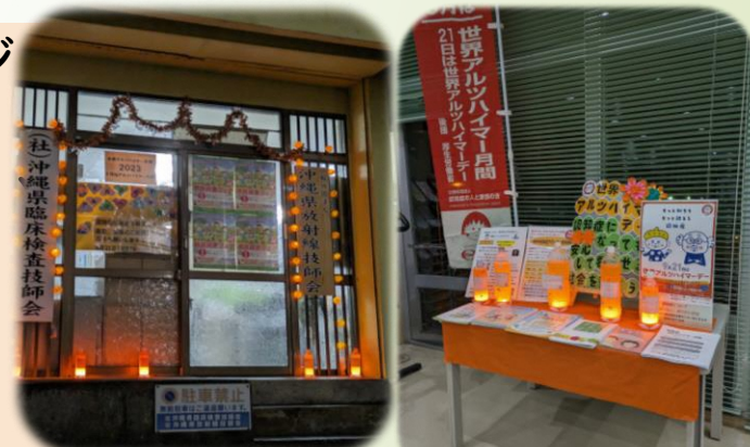
沖縄県放射線・検査技師会 かりゆしセンター