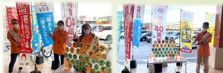
パークレーズコートにて啓発活動