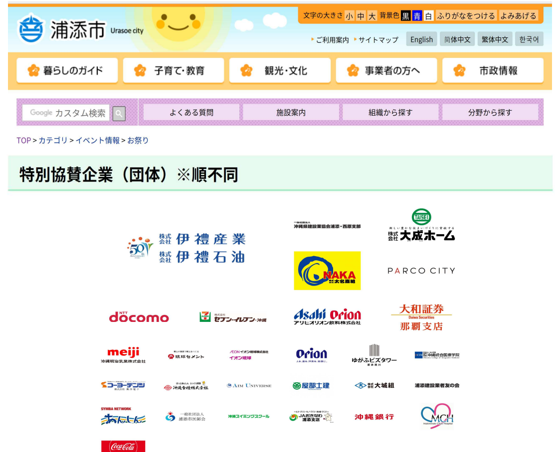
浦添市公式HPイメージ (第45回特別協賛企業)