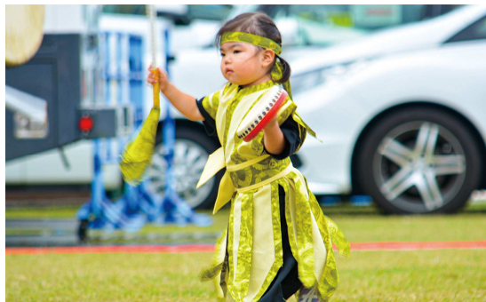
ちびっ子カーニバル