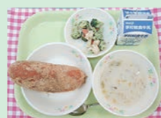
▲子どもたちの成長のための「おいしい給食」

現在、浦添市では小学生で月額4200円、中学生で4600円の給食費を頂いていますが、仮に給食費を0円にして保護者負担をなくしても食材費は変わらないので、前述したように物価高騰が続けば、給食の「質」に影響が出てしまいます。本当にそれでいいのか、ずっと悩んできました。そこで、