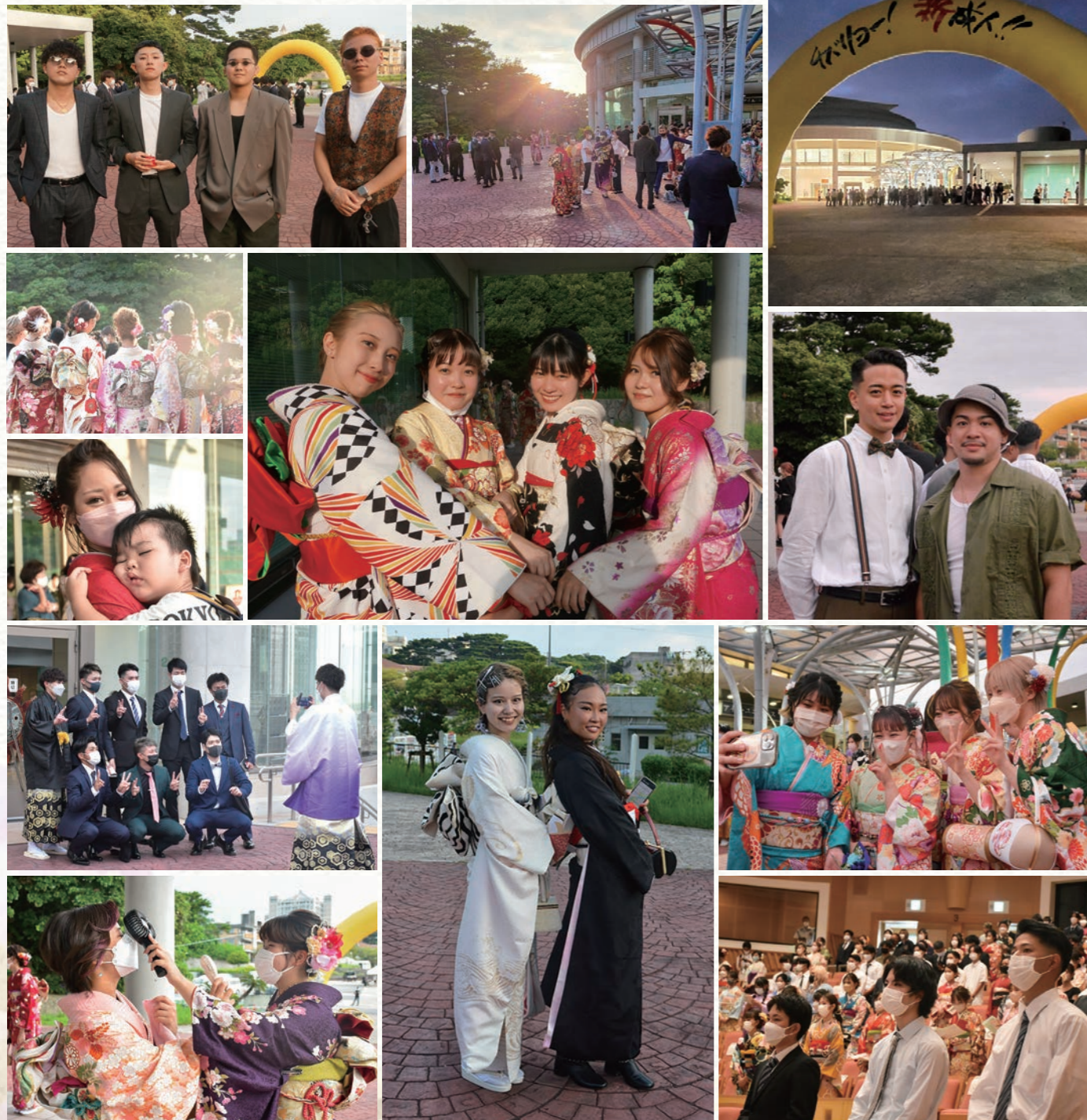
※撮影時のみマスクを外しています。