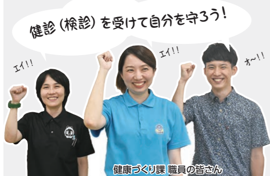
健康づくり課 職員の皆さん

A.補助を受けられます。ただし、市が補助している額を超えた分は自己負担になります。