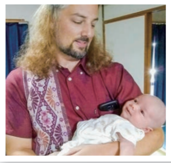
▲おはようございます! Good morning!