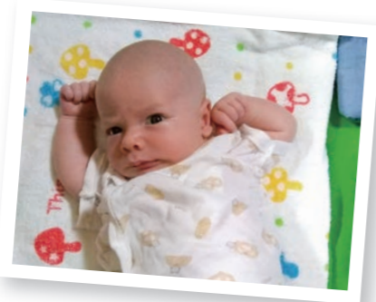
▲家族とおうちでご対面 After arriving home from the hospital.