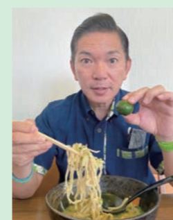
▲市長考案シークワサー 沖縄そば

ハイサイ こちら市長室! 「沖縄そば&シークワサー」 今月9月22日はシークワサーの日です。県内どこでもよく見かけるシークワサー。お刺身に搾ったり、泡盛に入れたり、沖縄を代表するかんきつ類の一つですが、まさにこれからがシーズンです。そこで今回は私が新しい楽しみ方を、なぜか少し上から目線でお教えします(笑)。それは、お馴染みの沖縄そばに、シークワサーを搾ると実に爽やかな新しい味わいになるのです。 この食べ方を思いついたのは、数年前にベトナムを訪れた時。私はベトナム料理のフォー(ライスヌードル)が大好きで、ベトナム滞在中は、ほぼ毎日食べていました。そのフォーと一緒に出されるのがライムです。店では切られたライムが各テーブルにどっさりと置かれ、好きなだけフォーに搾って食べていいのです。これが衝撃的に美味しくて、その時にふとフォーにライムがイケてるなら、沖縄そばにシークワサーもありなのではとひらめいたのです。帰国後すぐに試食してみたら、これがうまいんです。さっぱりと爽やかで、全く別物の、沖縄そばの新境地を見出した気がしました。いくつかの有名な沖縄そばの店