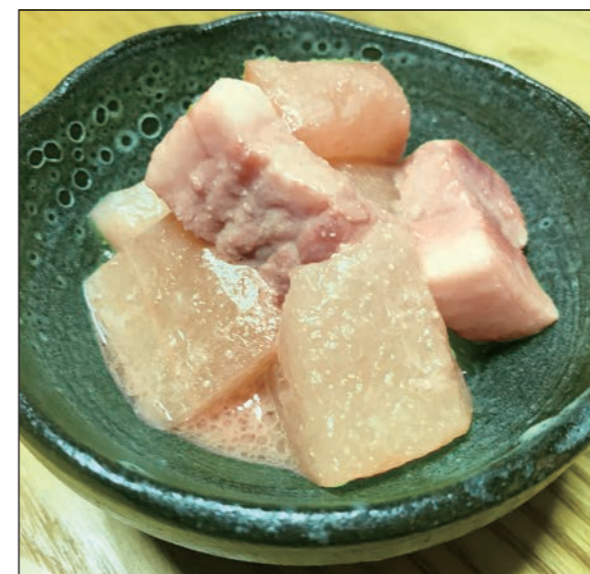
レシピ提供: 浦添市食生活改善推進員協議会