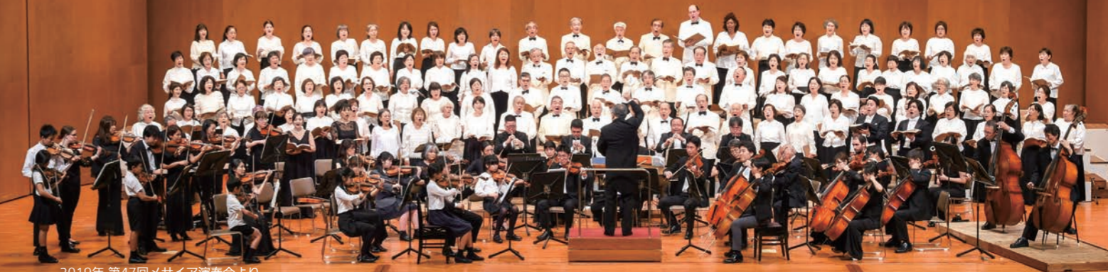
2019年 第47回メサイア演奏会より