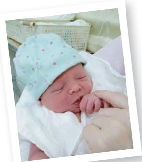
▲生後二日目 Day after he was born.

赤ちゃんがここ沖縄で生まれたことがとても嬉しいし、今後の数年間の子どもの成長ぶりを見るのを楽しみにしています!