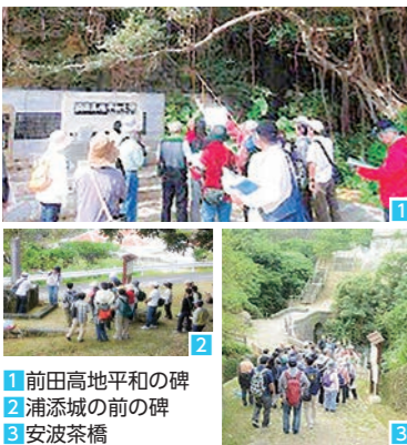
1 前田高地平和の碑 2 浦添城の前の碑 3 安波茶橋

知識豊富な歴史ガイドと一緒に浦添の魅力を発見 ここにちは!今月はNPO法人うらおそい歴史ガイド友の会を紹介! 浦添市教育委員会に認定されたガイドで構成され、浦添城跡をはじめ、浦添市内の文化財・戦跡などのガイドのほか「浦添ブスク・ようどれ館」の展示物解説などを行っています。 また、多くの市民が参加する歴史関連イベントを主催したり、浦添市主催イベントへの協力や支援も行っています。 ガイドさんから話を聞きながら街歩きをすれば、ガイドブックにはない話や訪れるだけでわからない貴重な話をたくさん聞くことができます。当時の情景が思い浮かんで、いつもの景色とはまた違った景色も見えてくるかもしれませんよ! ぜひ、ご家族や友人を誘って市の歴史や魅力を楽しみながら学んでみてはいかがでしょうか。