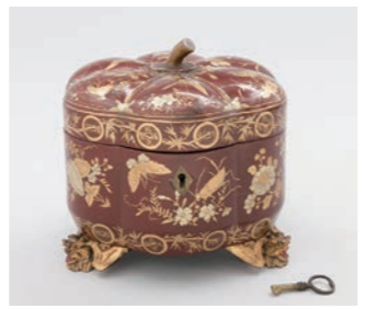
うるみぬりかちようかんどんまきえうりがたちばいれ ▲潤塗花鳥広東時絵瓜形茶葉入(中国) 貴重な茶葉だったのか? 鍵付きの道具です。