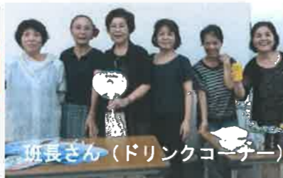
班長さん（ドリンクコーナー）