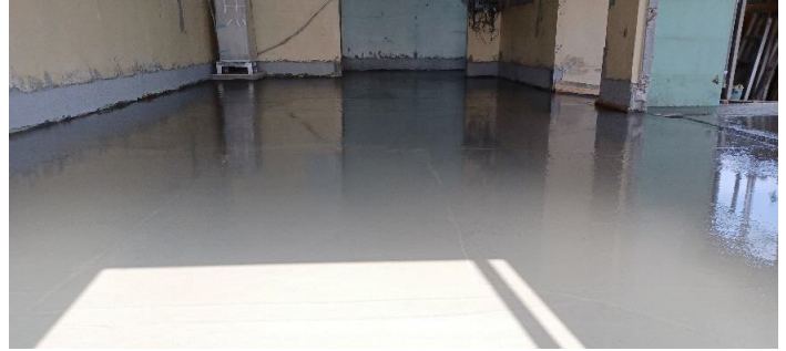
床コンクリート打設