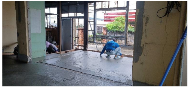
床コンクリート打設