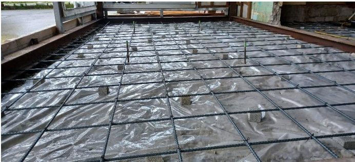
床コンクリート打設配筋