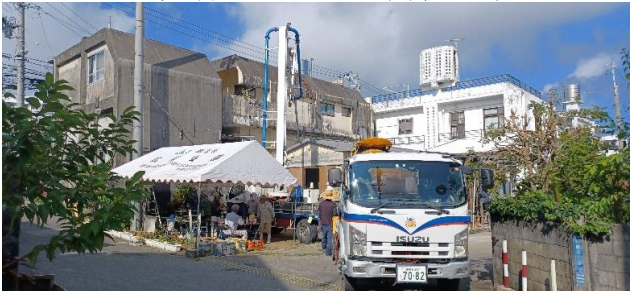
床コンクリート打設