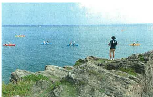
カーミージーの上からの監視も必須