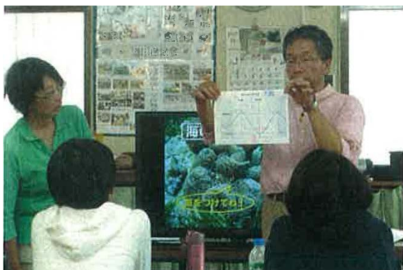
満潮・干潮時間の確認