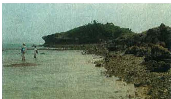
カーミージーの南側