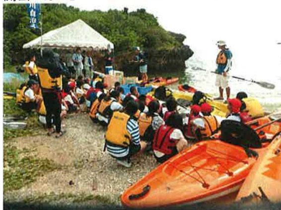
カヌーの安全走行について説明を受ける