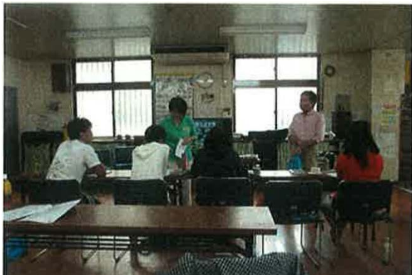
スライドやテキストを用いた座学の様子