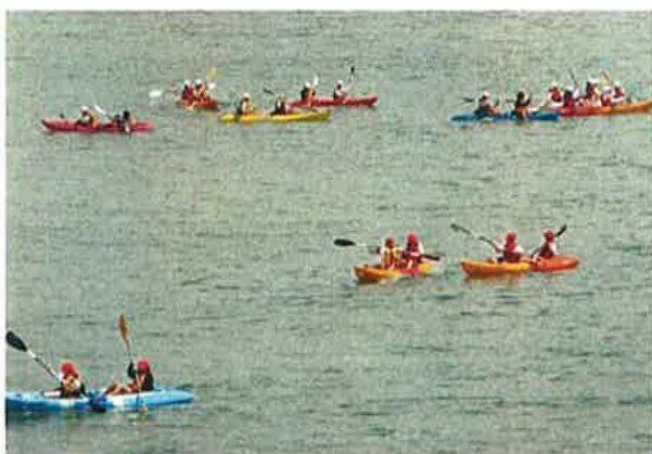
慣れてくると競争も