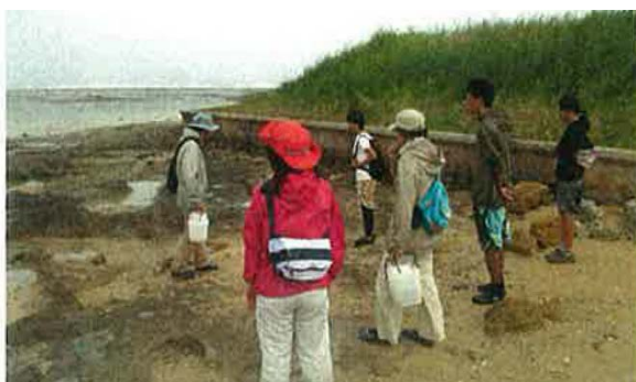
観察会の概要説明を受ける