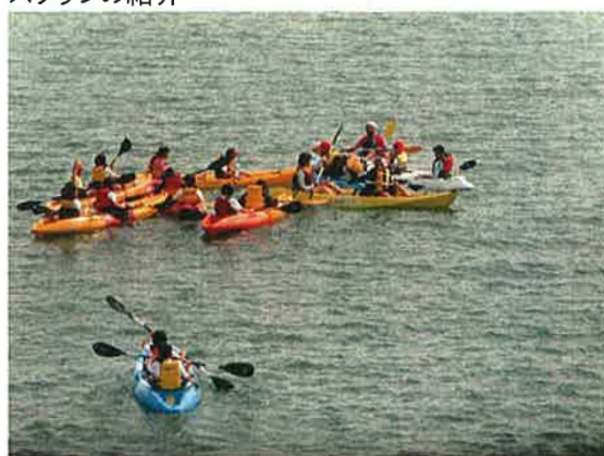
波風も穏やかな海上