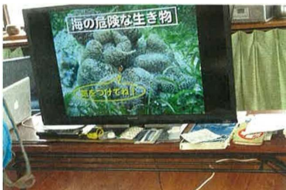
テレビモニターを使用して解説