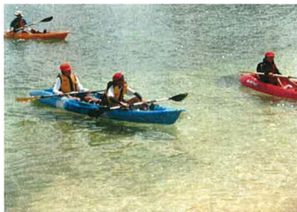
浅瀬に戻り体験終了