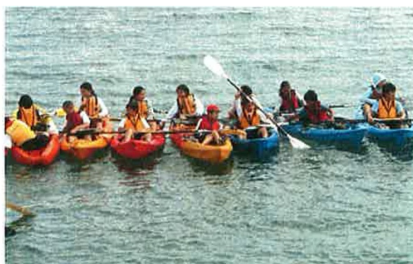
一列になって、一時休憩