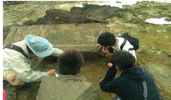
崩壊したコンクリート護岸にも生物が生息