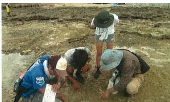
生物が生息する環境の確認