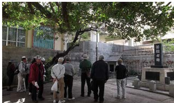
○屋富祖の御嶽・殿