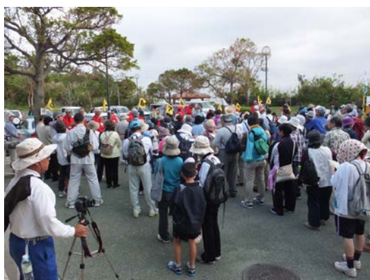
○開会式の様子（約 250 名の参加）

【コース】浦添グスク→浦添城の前の碑→安波茶橋→経塚の碑→浦添御殿の墓→ニシヌヒラ・フェーンヒラ→太平橋→儀保クビリ→安谷ガー→安谷川御嶽→中城御殿跡→世持橋→園比屋武御殿→久慶門