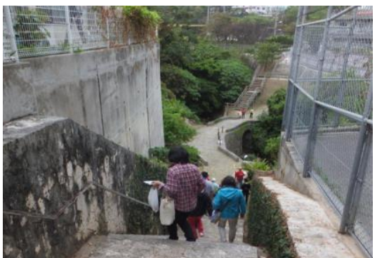
○市指定文化財「安波茶橋」