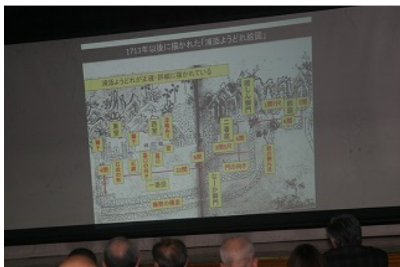
○「ようどれ絵図」を用いての説明