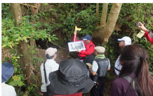
○浦添城跡南側斜面にある糧食壕