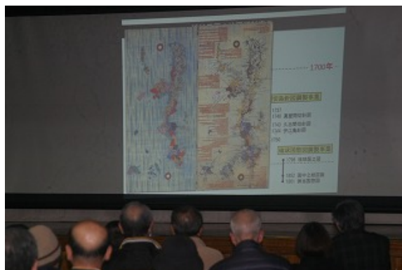
○「琉球国の図」などを用いての説明