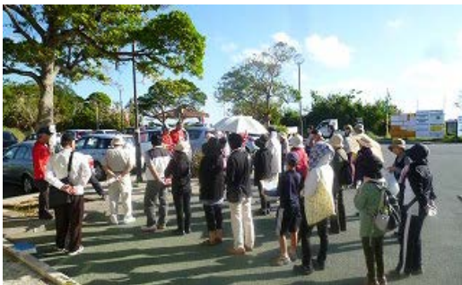
○浦添グスク・ようどれ館前