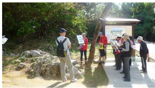
○浦添ようどれ案内板