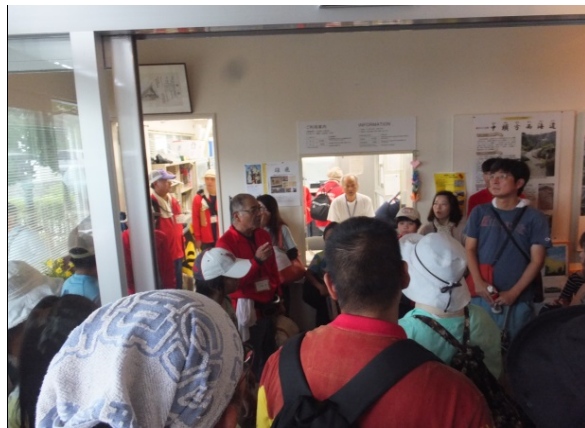
〇残念ながら雨天中止が告げられました