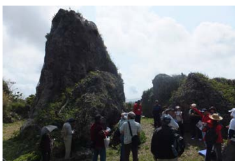
○ワカレジー（為朝岩）