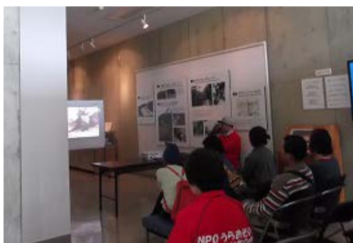
○「前田高地」に関するDVD鑑賞