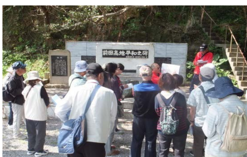
○前田高地平和之碑

【コース】浦添グスク・ようどれ館→浦和の塔・ディーグガマ→浦添城跡→前田高地平和之碑→ワカレジー（為朝岩）→糧食壕→乾パン壕→クチグワーガマ→浦添グスク・ようどれ館