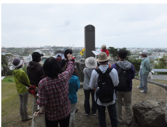
○「浦添城の前の碑」にて