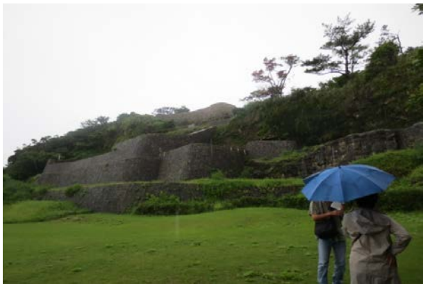
2014.9.6.(土) 景勝地（写真）応募作品 現地視察 ★ようどれ、浦添城跡 他