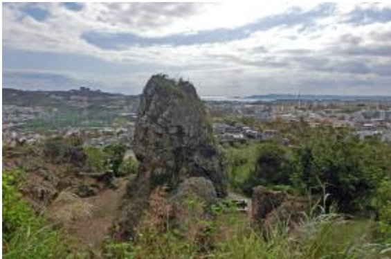
3. ハナリジー（為朝岩）