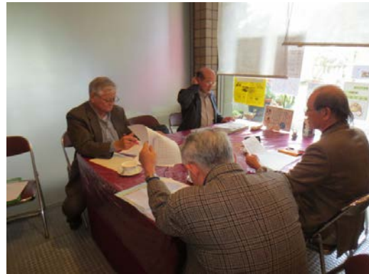
「浦添八景」の選定 第二次公募（短歌）審査委員会 平成27年1月16日（金） 場所：浦添市美術館内喫茶花うるし