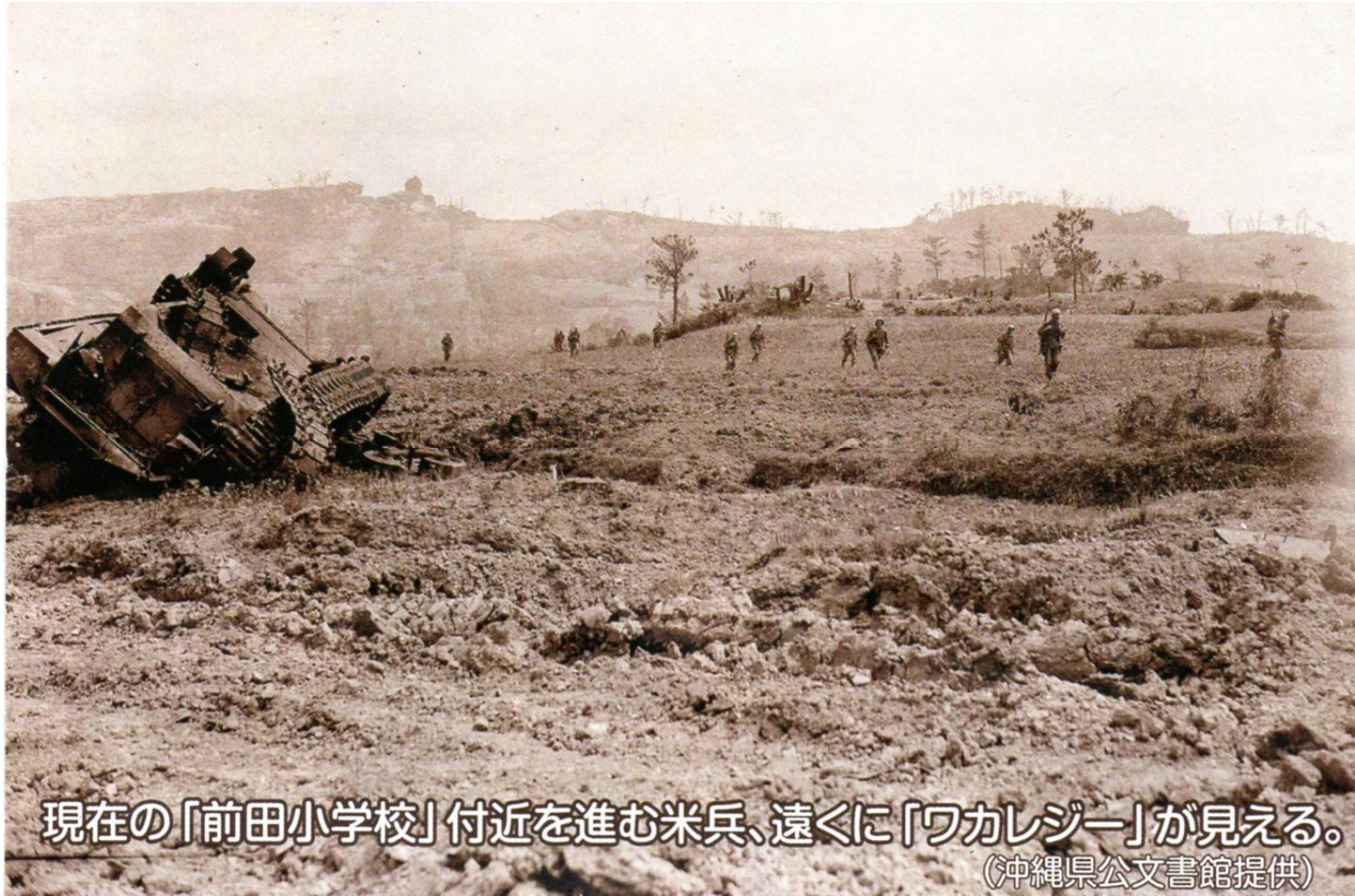
現在の「前田小学校」付近を進む米兵、遠くに「ワカレジー」が見える。