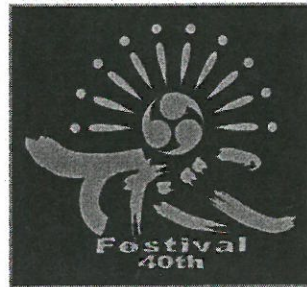
左袖: 1Pサイズ(シルバーインク)