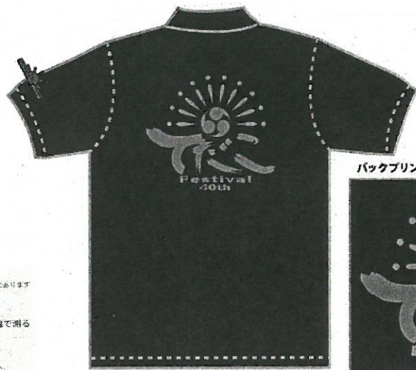
バックプリント: B4サイズ(シルバーインク)