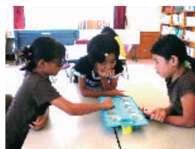
▲各センターで大会が開かれるほど大人気のボードゲーム「マンカラ」は、年齢問わず楽しめます。

午後の児童センターは、学校を終えた子ども達が主役です。「こんにちは」と元気にあいさつしながら入ってきた子ども達は、体育館のようなプレイルームで「輪車乗り」やドッジボール、バスケットボールなどをして伸び伸びと遊びます。図書室では、ゆっくりと読書をしたり、お絵かきをしたりできますし、集会室ではベーゴマやけん玉、将棋などのじっくりと考える遊びを楽しむこともできます。