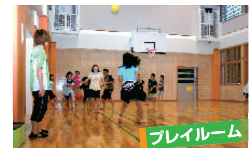
▲ドッジボールやバスケットボール、バドミントンなどの軽スポーツが楽しめます。

の様子をよく見渡すことができます。また、南側に向けて多くの窓を設置しているため、風通しが良いのも特徴です。 2階部分には学童クラブ室が2部屋あり、学校を終えた子ども達は、学校の敷地外へ行くことができます。