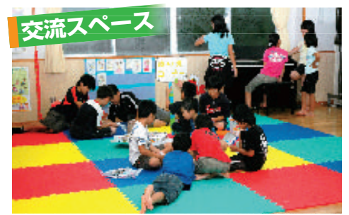
▲マットを敷いているので、赤ちゃんと一緒にコミュニケーションに最適です。

本市で11番目の児童センターとなる「浦添市立前田ユブシが丘児童センター」がオープンし、市内すべての小学校区において児童センターの整備が完了しました。 この施設は前田小学校に隣接しているため、広く地域の方が利用でき、また、学校と連携した行事や子育て支援が積極的に展開できるようにしています。