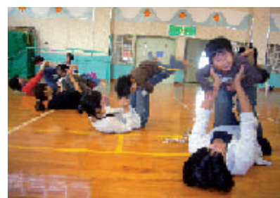
▲親子クラブの活動として行われたリトミック教室。このほかセンターでは親子同士で交流できる行事が盛りだくさんです。

午前中の児童センターは、主にお母さんと赤ちゃんが親子でゆったりとくつろぐ時間です。絵本やおもちゃと一緒に遊んだり、親子同士でリトミックや体操、季節行事の水遊びなど、親子クラブの活動に気軽に参加したりすること