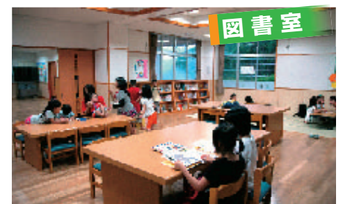
▲読書や読み聞かせ、大型スクリーンを使用した映画会など、幅広く活用できます。

毎週火・木曜日の午後8時から10時までは、一般の方に開放しています。(18歳未満の方は保護者同伴でも利用できません)。個人の利用はもとより、児童センター内の各施設を利用して、サークル活動やコミュニティ活動、ボランティア活動などを行うことが