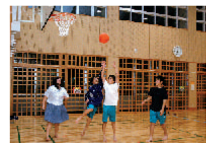
▲夕方の夜間開放では、中高生が思い思いに過ごします。また働く保護者にとって親子のふれあいの場としても利用されます。

施設概要は、敷地面積約887㎡、延べ床面積約682㎡の鉄筋コンクリート2階建てとなっていて、エレベーターも完備された段差の無いバリアフリーとなっています。プレイルーム・図書室・集会室・創作活動室など児童厚生施設としての機能は、すべて1階部分にあるため、職員(児童厚生員)がセンター内