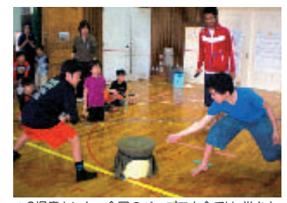
▲3児童センター合同のベーゴマ大会では、巻き方・投げ方を教えあうなど、地域を越えて子ども達が交流しました。

できます(10名以上の場合は団体利用申請が必要です)。バドミントンやソフトバレーボールといった軽スポーツを楽しむながら、健康づくり、絆づくりをチャレンジしてはいかがでしょう?