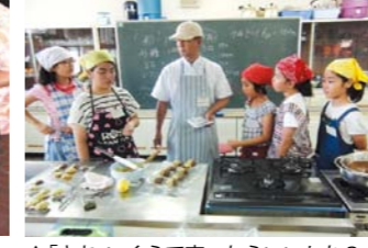
▲「さあ、いくらで売つたらいいかな？」

館料理実習室 対象 市内在住・在学の小学4年生～中学3年生 費用 材料費600円 定員 15人 申込期間 7月17日(金)～30日(木) 電話・窓口先着順 ■お笑いに挑戦！ ネタ作りから表現方法まで、プロに学んで分館子どもフェスタ(8月8日)で発表します。 日時 7月27日(月)・30日(木) 8月3日(月)・6日(木) 13時～15時 場所 中央公民館分館 対象 市内在学の小中学生 費用 無料 定員 10人 申込期間 7月10日(金)～24日(金) 電話・窓口先着順