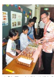
▲「お買い上げありがとうございます」

■親子星空教室2 夏の大三角形、七夕の星等、親子で夏の夜空を観測し天体へ興味関心を深めましょう。 日時 7月17日(金) 19時30分～21時30分 場所 浦添市養蚕絹織物施設サン・シルク駐車場 対象 市内在住小中学生親子(15組) 費用 無料 申込期間 7月10日(金)～16日(木) 電話・窓口先着順