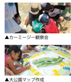
▲カーミージー観察会

対象 浦添市内在住・在学の小学3年生～6年生程度 定員 30人(定員を超えた場合は抽選) 参加費 無料(傷害保険込み) 申込期間 7月28日(火)まで 申込方法 必要事項(お名前、連絡先等)を「電話」「FAX」「メール」のいずれかで申込み 申込先 (株)沖縄環境科学研究所 ☎ 893-1844 FAX 893-1844 mail eco-u@nirai.ne.jp