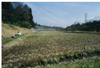
小集団の未整備農地