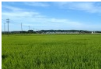
生産性の高い優良農地