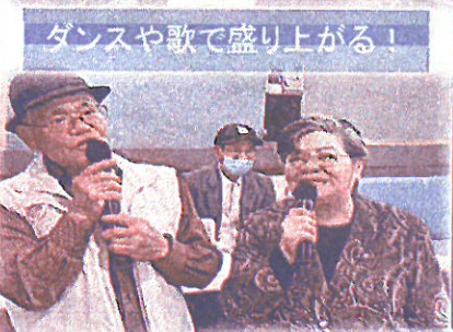
ダンスや歌で盛り上がる!

2023年一年の「忘年」と、来年の「希望」ある新年度に向けて、2024年は更に自治会の仲間と自治会活動のご支援とご参加をよろしくお願ひします!