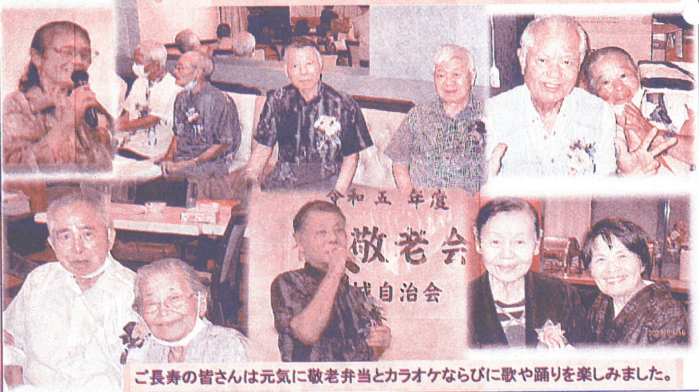
ご長寿の皆さんは元気に敬老弁当とカラオケならびに歌や踊りを楽しみました。