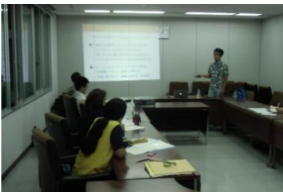
「面白い企画書づくり」の講座に身を乗り出して興味津々