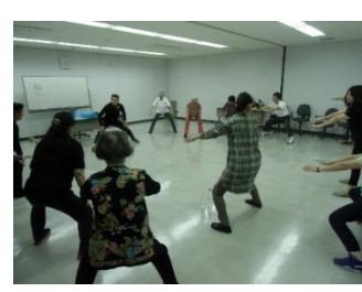
スクワットが体幹を鍛えてくれます