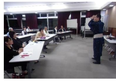
琉球の文化と芸能・琉舞の所作を実演解説