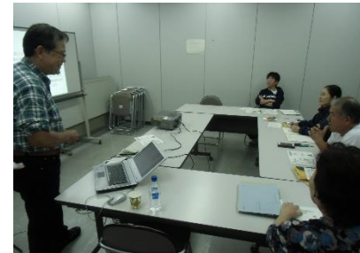
超高齢化社会について・・・皆、真剣です