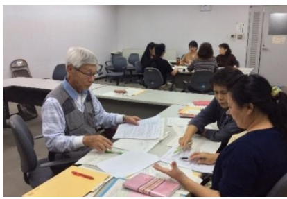
卒業研究に取り組む文化・教養振興学部。手前は寸劇を発表する俳優・女優？の皆さんです