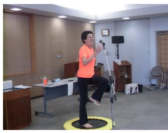
正直マイクはいらなかった元気ハツツ尾尻インストラクター