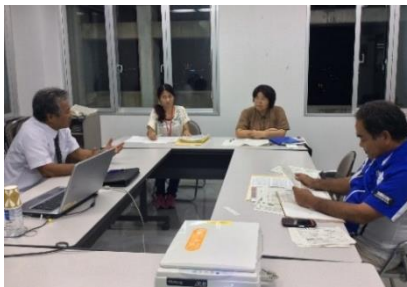
卒業研究について思いを語り合う高良学部長と学生のみなさん