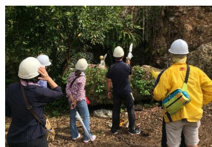
文化財の発掘体験。いつか歴史的発見があるかも？