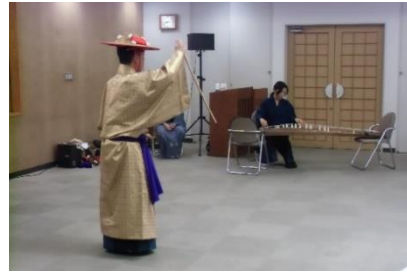
琉球の文化と芸能・組踊「執心鐘入」。琴の音色と厳かな踊りに感動