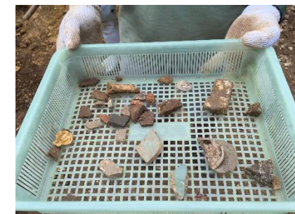
発掘調査中に出てきた、陶磁器や瓦の破片

てだこ市民大学 文化振興・教養学部 1年次 講座 浦添城跡発掘調査 浦添城跡発掘調査の講座が10月に実施され、陶磁器や瓦の破片が20点以上も出てきました。受講した学生からは「破片が出てきて、時が止まったようだった」また受けてみたい授業です」等の声もあり、充実した講座になりました。