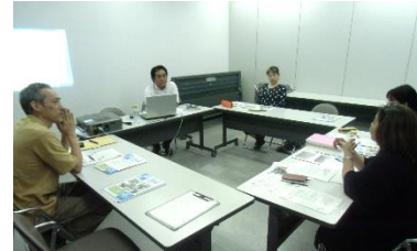
学生同士も意見を出し合います