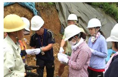
浦添城跡発掘調査にて発掘の説明をうける学生達