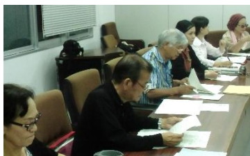
熱心に授業を受ける学生