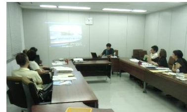
資料だけでなく動画を見ることも