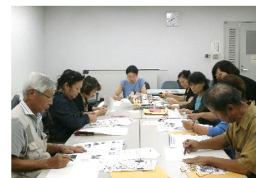
湧き水マップを一生懸命作成中！