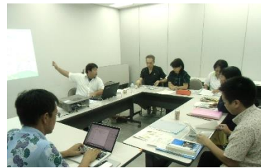
講師とのディスカッションで講座は充実！