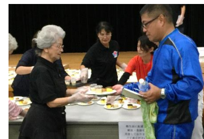
スイーツを配布する市民大学生

※詳細は広報うらそえ(11月号)、浦添市ホームページで確認できます。または、事務局まで!