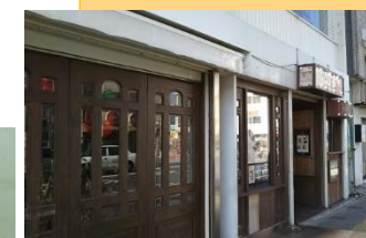
シアタードーナツ