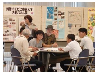
市民大学の学生・卒業生も中学生と一緒に平和について考えました。