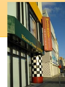
沖縄市戦後文化資料展示館ヒストリート