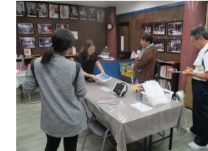
沖縄市一番街（沖縄市音楽資料館おんがく村）