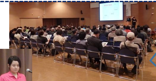
市民大学の学生も司会、受付、会場整理などで大活躍！