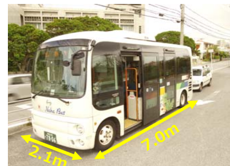
▼小型バス（ポンチョ）