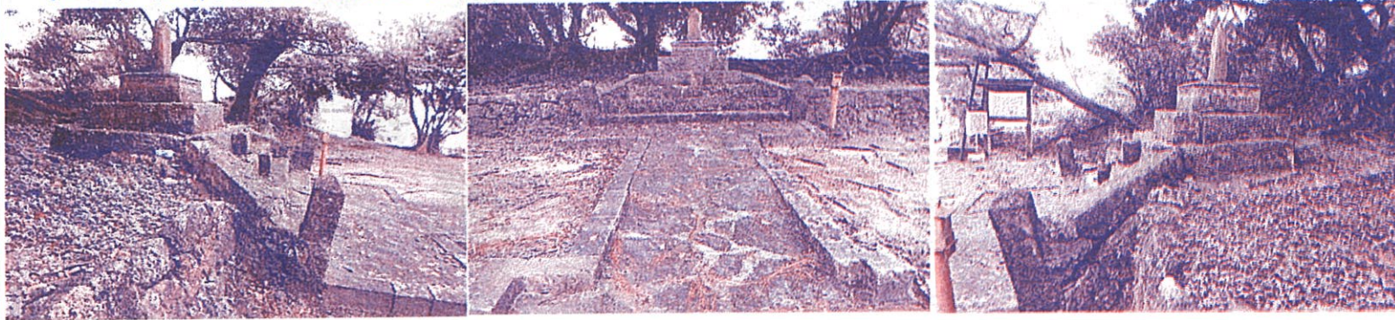
現在の「経塚の碑」向かって右側部分の損壊がすすんでいます

「経塚の碑」は浦添の歴史的あるいは学術的解明に貴重であり、指定して保護すべきものとして、昭和56年3月2日に市史跡に指定されています。「経塚の碑」の補修歴は昭和4年に部落有志により碑台を補修。平成7年に石積み及び階段・参道の補修と植樹を実施しています。しかし、周辺の松の木の成長により樹根が石碑や石積みに影響を及ぼして、倒壊の危機にさらされており、早急な対策がせまられていました。碑建立500周年の節目の年にあたり、文化財課の協力のおかげで、修復に伴う予算補助金を確保することができ、補修工事が決定しました。碑の修理として石段、台座、左右袖石、欠損箇所修理。石積みのはらみだし修理、前庭のリユウキュウ松樹根対策及び剪定作業等を実施します。