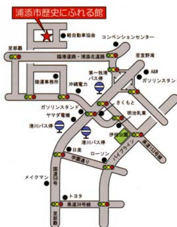
浦添市歴史にふれる館の地図