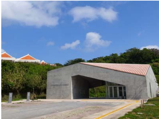
【浦添大公園南エントランス展示コーナー】

施設の中には「うらおそい歴史ガイド」が解説員としていますので、解説をご希望の方は気軽に声をかけてください。駐車場も完備しています（バス対応可）。