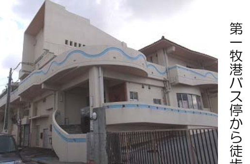
【浦添市歴史にふれる館（やかた）】

平成28年2月にオープンした文化財の収蔵展示施設。収蔵室の一部も公開しています。駐車場も完備しています。