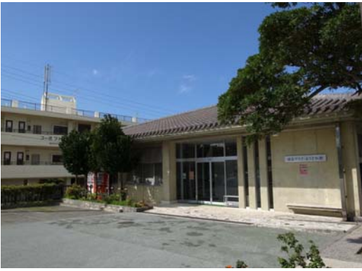
【浦添グスク・ようどれ館】

浦添ようどれ墓室（西室）の原寸大の模型がみどころ。館内は、NPO法人うらおそい歴史ガイドが展示の解説も担当します。駐車場も完備しています（大型バスも対応可）。