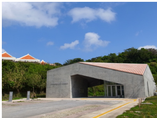
【浦添大公園南エントランス展示コーナー】

施設の中には「うらおそい歴史ガイド」が解説員としていますので、解説をご希望の方は気軽に声をかけてください。駐車場も完備しています（バス対応可）。