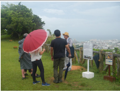
【うらおそい歴史ガイドによるガイドツアー】 現地だけではなく、企画展「沖縄県の戦争遺跡」の展示会場もご案内します。夏休み中に毎週開催しま