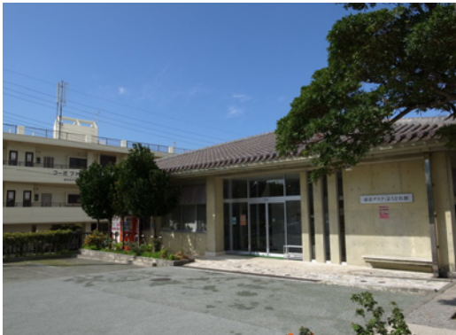
【浦添グスク・ようどれ館】

浦添ようどれ墓室（西室）の原寸大の模型がみどころ。館内は、NPO法人うらおそい歴史ガイドが展示の解説も担当します。駐車場も完備しています（大型バスも対応可）。