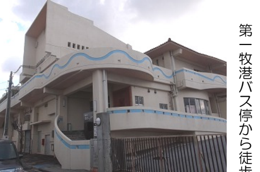
【浦添市歴史にふれる館（やかた）】

平成28年2月にオープンした文化財の収蔵展示施設。収蔵室の一部も公開しています。駐車場も完備しています。