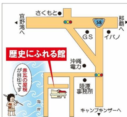
浦添市歴史にふれる館の地図