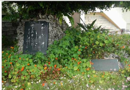
【おもろの碑・めじろ公園】 琉球の古謡を集めた歌謡集『おもろさうし』に、沢岬について謡われた古謡が収録されています。そのおもろを刻んだ石碑がめじろ公園に建てられています。