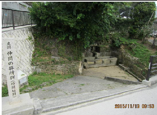
【仲間樋川】(浦添市指定史跡) 仲間の四箇所の拝所が「仲間の拝所群」として市の文化財に指定されており、仲間樋川はそのうちの一つです。現在は復元整備され、自由に見学が可能です。