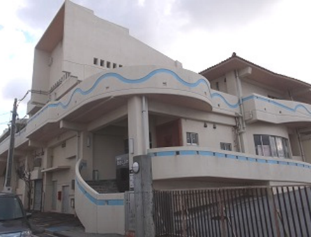
【浦添市歴史にふれる館（やかた）】

平成28年2月にオープンした文化財の収蔵展示施設。収蔵室の一部も公開しています。駐車場も完備しています。