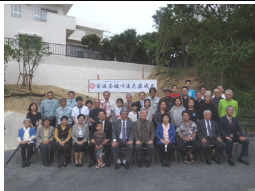
【史跡安波茶樋川復元落成式】

一般の方や観光客なども出入り自由ですので、水のせせらぎが聞こえる安波茶樋川をぜひご利用頂きたいと思えます。