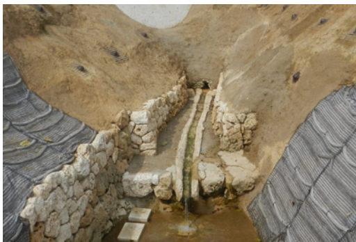
【安波茶樋川】市指定文化財（史跡）

平成14年に浦添市の文化財指定を受けましたが、周辺の斜面から土砂が流れ込み、長らく復元がまたれていました。平成25年から市の「地域資源復元推進事業」の一環として、復元整備工事が行われ、平成29年3月に整備が完了しました。そして先日、完成を記念して4月16日に史跡安波茶樋川の復元落成式が行われました。