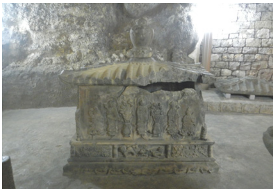
【浦添ようどれ石厨子】県指定文化財（彫刻）

浦添グスクの近くにあるガイドダンス施設の「浦添グスク・ようどれ館」は、学習施設として平成十七年に開館しました。館内には、浦添グスクの発掘調査の出土品や、戦前の浦添ようどれの写真などを展示しています。また、浦添ようどれの西室（英祖王陵）の内部を実物大で再現した部屋があり、お墓の中にあるよ