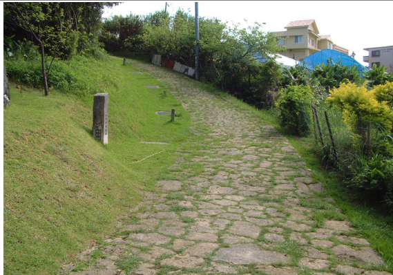
【普天満参詣道】（国指定史跡）

地域では「当山の石畳道」と呼ばれています。琉球国王が普天満宮を参詣する際に通ったといわれています。平成24年9月19日に国の史跡に指定されました。