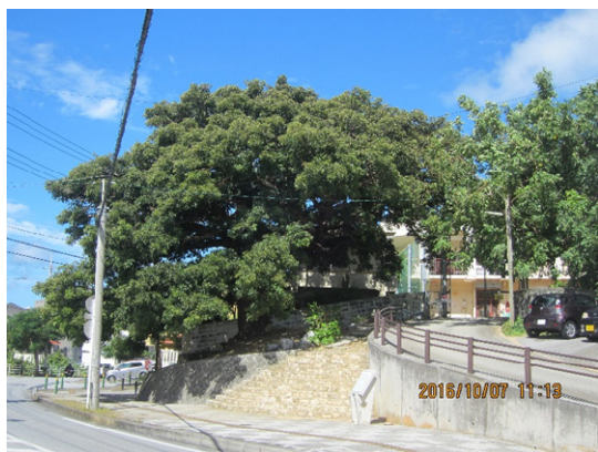
【内間の大アカギ】(浦添市指定天然記念物) 沖縄でアカギは、長期間水に浸し、十分に乾燥させ、建築材・家具材・農機具材として利用されていました。

内間のアカギは、激動の時代を強かに生きた樹木の一つであり、人々の暮らしを見守ってきた老木です。また、かつ