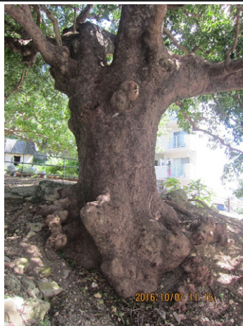
↑内間の大アカギの立派な幹