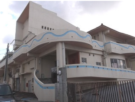
【浦添市歴史にふれる館（やかた）】

平成28年2月にオープンした文化財の収蔵展示施設。収蔵室の一部も公開しています。駐車場も完備しています。