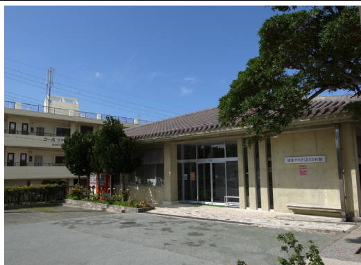
【浦添グスク・ようどれ館】

浦添ようどれ墓室（西室）の原寸大の模型がみどころ。館内は、NPO法人うらおそい歴史ガイドが展示の解説も担当します。駐車場も完備しています（大型バスも対応可）。