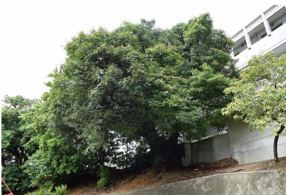
【宮城の御願山のウスク】

浦添市の指定天然記念物。宮城公民館一帯はかつて「御願山」と呼ばれた聖域で、このウスクはかつての御願山をしのばせる唯一のものです。樹齢は100年以上と推測されています。