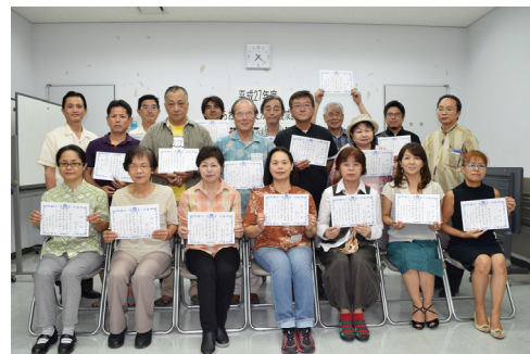
【うらおそい歴史ガイド [5期生]】

養成講座は、7月から9月までの2か月間で、全8回にわたる講座が行われ、レポート提出、筆記試験、実地試験をクリアした19名に認定証が交付されました。