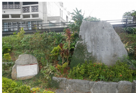
おもろの碑（写真は仲間交番前の碑）

前の碑の説明板です。ぜひご覧下さい。市内に立つ「おもろの碑」を通して、先祖の心にふれ、浦添の歴史を振り返り、そしてこれからの浦添を考えるきっかけになることでしょう（粟森）