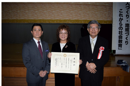
NPO 法人うらおそい歴史ガイド友の会

ガイド一人につき1時間程度（1500円）、2時間（3500円）でガイドお引き受けします。県外からの皆様は半額です。お気軽にご連絡下さい。