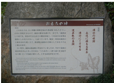
装いも新たに変わった説明板

市内の10箇所に建立されています。文面で紹介した8カ所以外には、牧港漁港と字伊祖・あさやら公園にも建てられています。ぜひ全てまわってみてください。