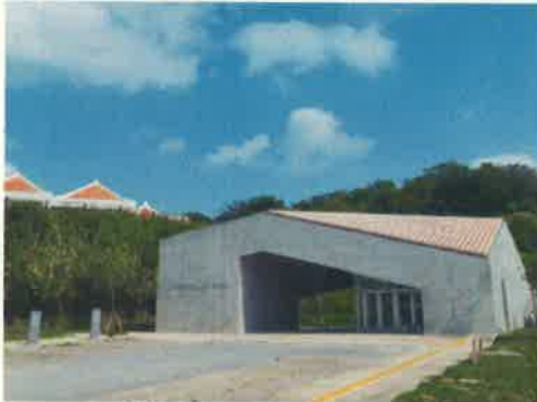
【浦添大公園南エントランス展示コーナー】

施設の中には「うらそえ歴史ガイド」が解説員としていますので、解説をご希望の方は気軽に声をかけてください。駐車場も完備しています（バス対応可）。