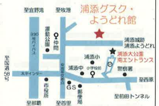
※仲間バス停から徒歩5分