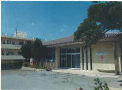
【浦添グスク・ようどれ館】

浦添ようどれ墓室（西室）の原寸大の模型がみどころ。館内は、NPO法人うらそえ歴史ガイドが展示の解説も担当します。駐車場も完備しています（大型バスも対応可）。