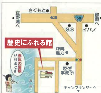
浦添市歴史にふれる館の地図

施設の中には「うらそえ歴史ガイド」が解説員としていますので、解説をご希望の方は気軽に声をかけてください。駐車場も完備しています（バス対応可）。