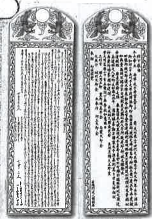
左(複製名文) 右(真文)

享年五六。尚寧王は浦添ようどれに眠っています。もしデスマスクがあつたとしたら、意志の強さと王の威厳を漂わせる凛としたお顔に違いない。亡くなって四百年に思うこのごろです。